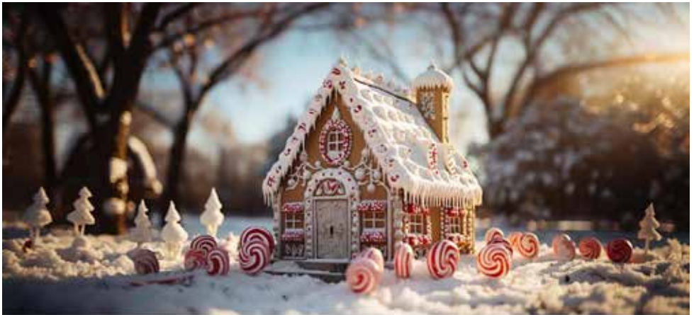
illustration: jeannette atherton - pixabay

Herzliche Adventsgrüße von allen Menschen, die Sie im digitalen Advent aus Ihrer Region entdecken können.